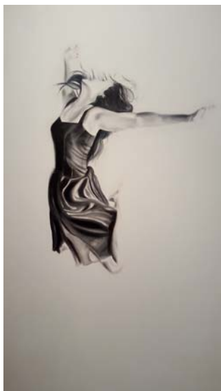
Silvia Caimi - Assoluto , 2014