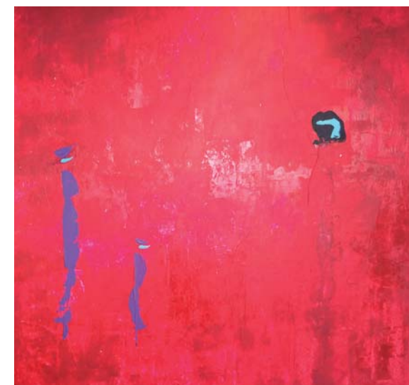
Andrea Pirani - Apparenze , 2015 particolare