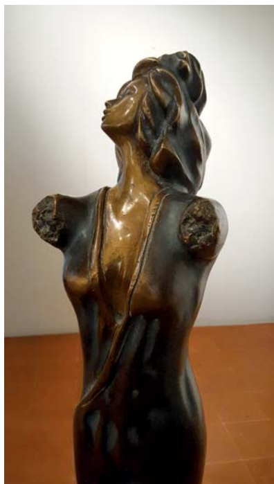
Amerigo Dorel - Sogno di donna , 2014