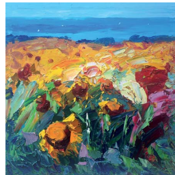
Agostino Veroni - L'emozione intensa dei girasoli in toscana , 2015